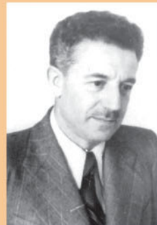
МАЛІС ГЕОРГІЙ ЮРІЙОВИЧ

Нагороджена орденами “Знак пошани”, медаллю С.П. Боткіна. Заслужений діяч науки та техніки України.