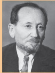
ЩУПАК НАТАН БОРИСОВИЧ

Народився 1890 року в м. Катеринославі (Дніпропетровську). У 1929 році захистив докторську дисертацію на тему “Материалы к вопросам обмена холестерина”. У 1939 р. йому присвоєно вчене звання професора. Упродовж 1941-1944 рр. – завідувач кафедри пропедевтичної терапії Киргизького медичного інституту, а в 1944-1945 рр. – завідувач кафедри терапії Київського інституту вдосконалення лікарів. У 1945 р. призначений завідувачем кафедри факультетської терапії Чернівецького медичного інституту і за сумісництвом – завідувачем кафедри госпітальної терапії. Автор 37 наукових праць, які присвячені актуальним проблемам кардіології. Заслужений діяч науки УРСР.