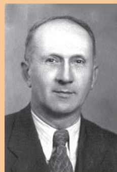
ТРІГЕР ВОЛОДИМИР АДОЛЬФОВИЧ

Народилася 18 квітня 1921 року в м. Кременчук Полтавської області. У 1950 році захистила кандидатську дисертацію на тему “Сердечно-сосудистая система при язвенной болезни”, а в 1958 році – докторську дисертацію на тему: “Клинико-экспериментальное обоснование новокаиновой терапии при язвенной болезни”. Автор 274 наукових праць, у т. ч. 10 монографій, 8 навчальних посібників. Під її керівництвом підготовлено 5 докторів та 21 кандидат медичних наук. Нагороджена орденами “Знак Пошани”, медаллю С.П. Боткіна. Заслужений діяч науки та техніки України.