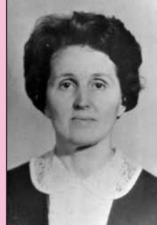
УСТИНОВА ОЛЕНА ІВАНІВНА

Народився 4.08.1909 р. у с. Ново-Олексіївка на Херсонщині. У 1940 році захистив кандидатську дисертацію, у 1945р. – докторську на тему “Рентгенлокалізація инородных тел глаза”. Засновник кафедри очних хвороб, започаткував її основні наукові напрями з вивчення глаукоми, рефракції ока та розробки новітніх методів діагностики. Автор 150 наукових праць, 4 монографій, 10 винаходів. Під його керівництвом підготовлені 1 доктор та 9 кандидатів мед. наук. Заслужений діяч науки України, нагороджений орденом Трудового Червоного Прапора, 5 медалями, значком «Відмінник охорони здоров'я». У 1994 році заснована студентська стипендія та премія Чернівецької міської ради його імені.